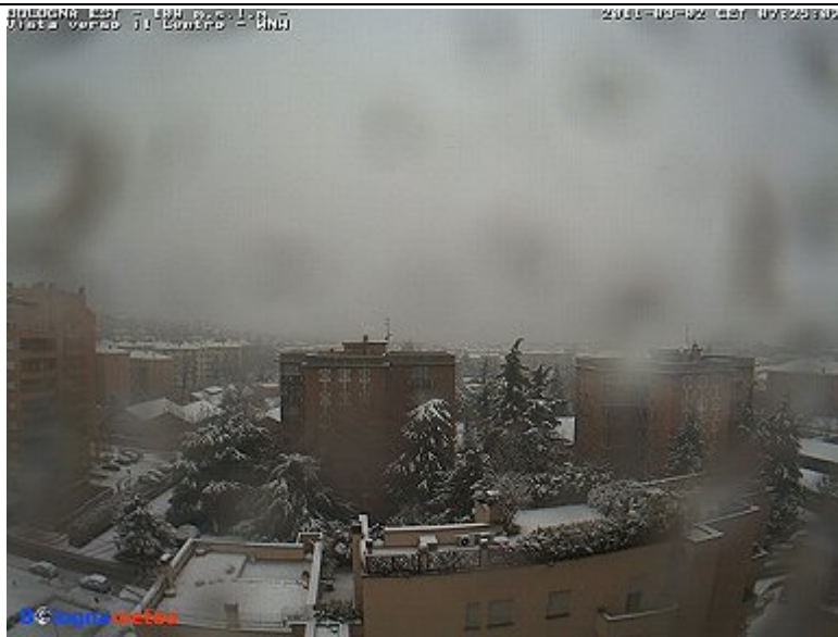
Bologna città stamattina ore 7:30