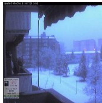
WEBCAM PARCO CAVE

13:00 continua a nevicare a Milano anche se in modo discontinuo e coreografico, 2 cm nei prati di periferia, nevicata ancora nella provincia di Como, mentre nel Lodigiano la neve si e' già trasformata in