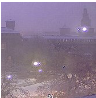
Milano: Castello Sforzesco