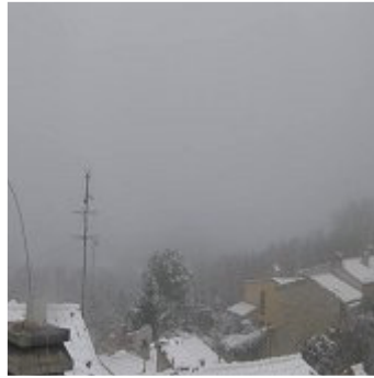
Cingoli (MT) 600 m