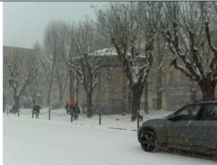
Stanotte e ieri sera neve forte su Toscana , alcune foto di Firenze