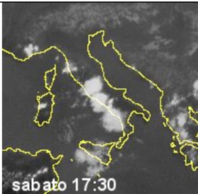
[18:30] situazione del satellite alle 17:30: notare formazioni temporalesche solo al centro/sud e localmente su estremo nord/ovest. Le correnti in quota al Nord si sono disposte da nord/ovest, mentre al centro/sud provenivano da nord/ nord/est (vedi cartina sopra: vorticosita' in quota)*