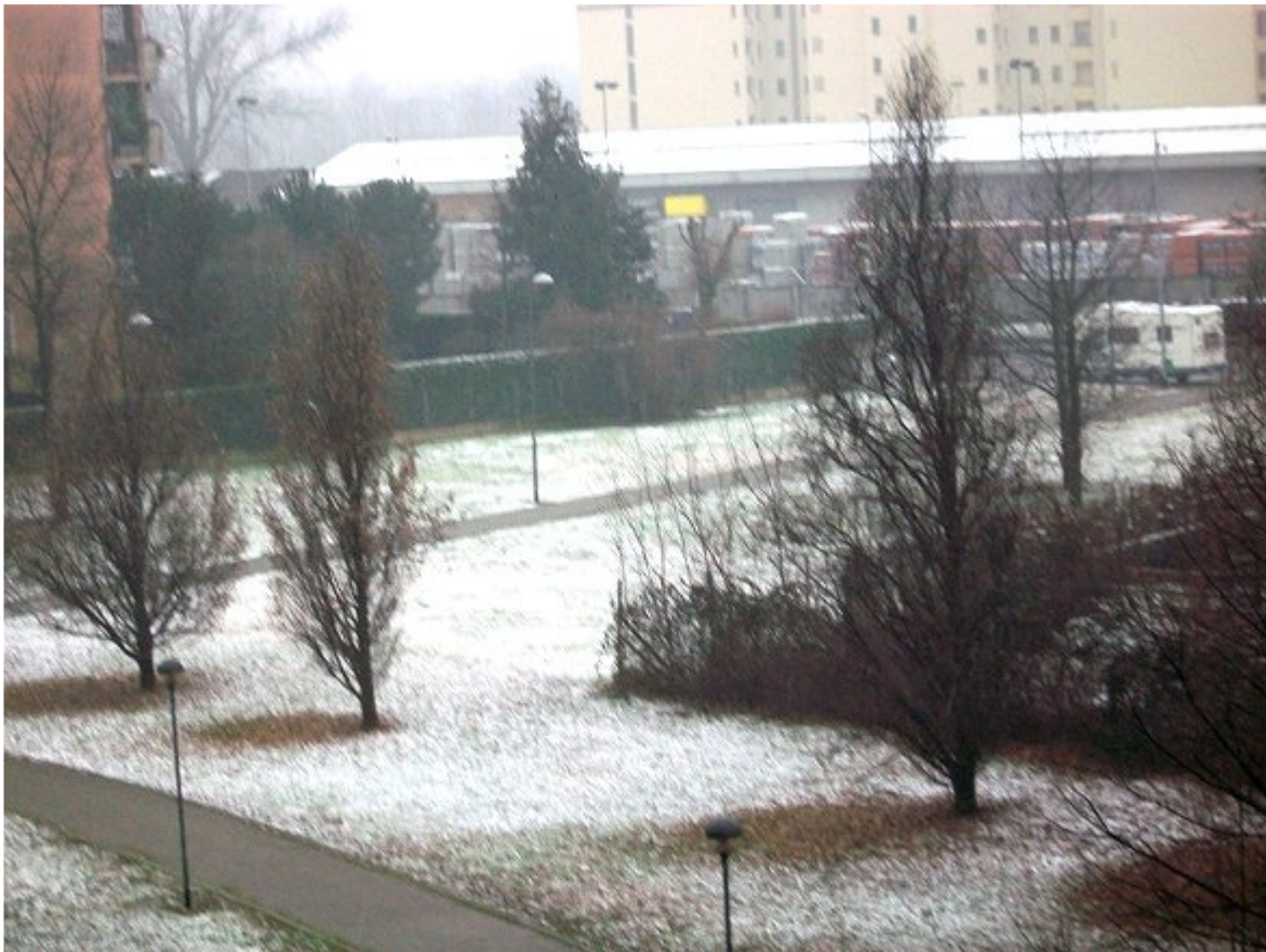
Parco delle Cave (Milano) stamattina

8:30 NORD: Nevica al Nord su Milanese, Lombardia meridionale, Basso Piemonte, Bassa Valle D Aosta, Emilia Romagna a tratti e localmente fino a Bologna ed entroterra Ligure. Accumuli più abbondanti nel pavese fino a 6 cm. Nel Milanese neve accumulata nei parchi circa 1 cm.