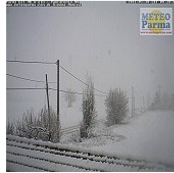
webcam Parma Est

8:30 NORD: Nevica al Nord su Milanese, Lombardia meridionale, Basso Piemonte, Bassa Valle D Aosta, Emilia Romagna a tratti e localmente fino a Bologna ed entroterra Ligure. Accumuli più abbondanti nel pavese fino a 6 cm. Nel Milanese neve accumulata nei parchi circa 1 cm.