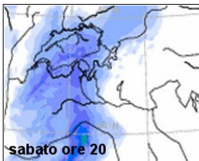
modello cosmo svizzera

home page | carte | webcam | servizi | stazioni | articoli | informazioni | weekend | meteo mondo | diretta |